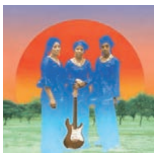
Les Filles de Illighadad