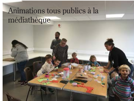
Animations tous publics à la médiathèque