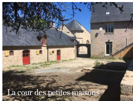
La cour des petites maisons

Les travaux des petites maisons seront terminés bientôt, la réception définitive du chantier est fixée au 17 juin.