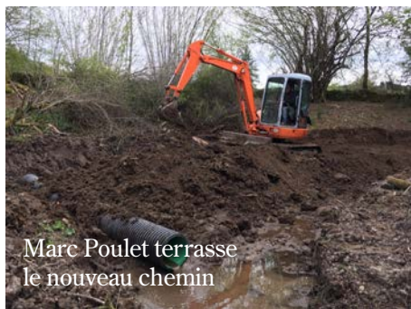
Marc Poulet terrasse le nouveau chemin