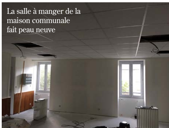
La salle à manger de la maison communale fait peau neuve

La création d'une salle de consultation au rez-de-chaussée arrière de la maison communale est maintenant possible puisque le plancher de la salle de restauration est terminé. Cela permettra d'offrir aux habitants de nouveaux services en proposant de mettre cet équipement à disposition des médecins , infirmiers, kinésithérapeutes, ostéopathes. Le Département a donné un accord de principe, il reste à convaincre la Région et l'Agence régionale de Santé.