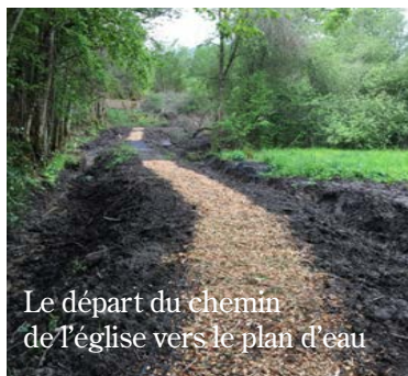
Le départ du chemin de l'église vers le plan d'eau